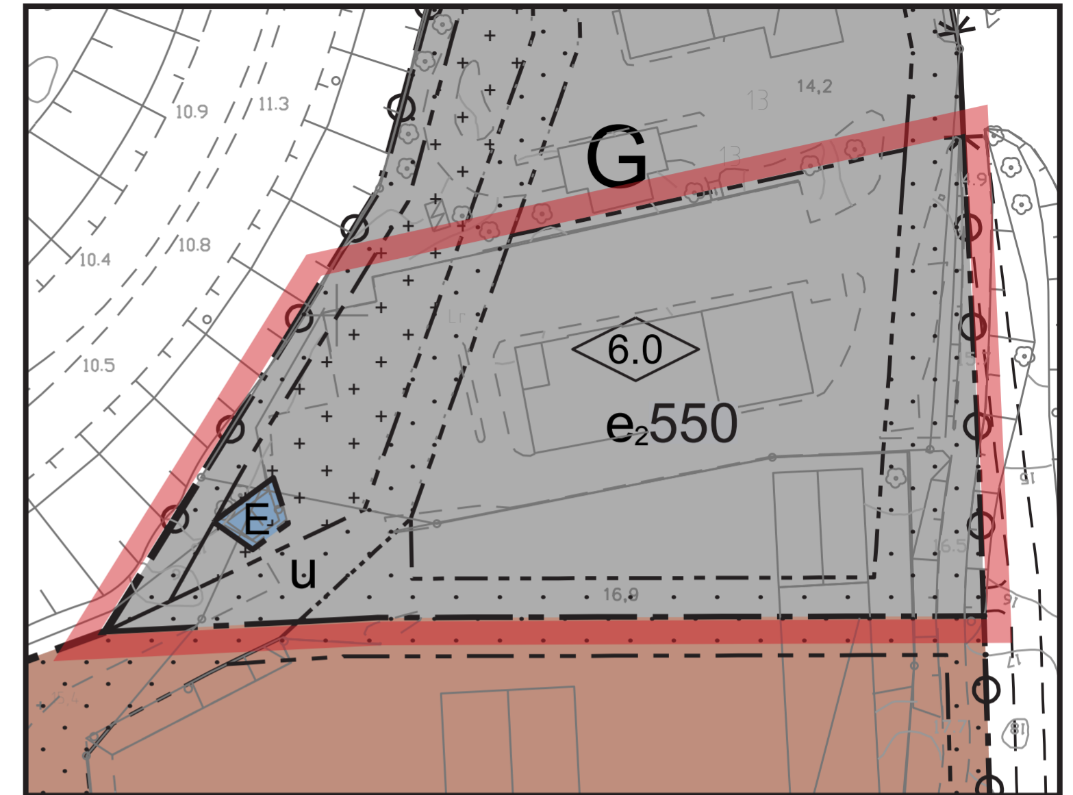
BILD 2: TILLHÖR ÄNDRAD DETALJPLAN A4999 (STÖRRE SKALA. VISAR ÄNDRAD DEL AV PLANOMRÅDET NÄR ÄNDRINGEN ÄR ANTAGEN.)