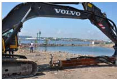
Visp som används vid masstabilisering av muddermassor, cementen vispas ned i muddermassorna.

Huvudförhandling med Mark- och miljödomstolen.