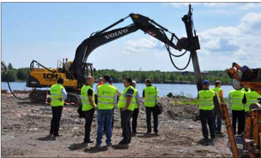
Många entreprenadföretag var på plats när projektet bjöd in till seminarium om pilotförsök för stabilisering av muddermassor.

Det har varit ett intensivt arbete med att ta fram underlag inför en kommande entreprenad sedan bidragsbeslut beviljades våren 2010. Nu är projektet moget för att handla upp saneringsentreprenaden. Upphandlingen kommer att löpa parallellt med tillståndsprocessen. Kontrakt med entreprenör planeras i samband med att dom meddelas våren 2012.