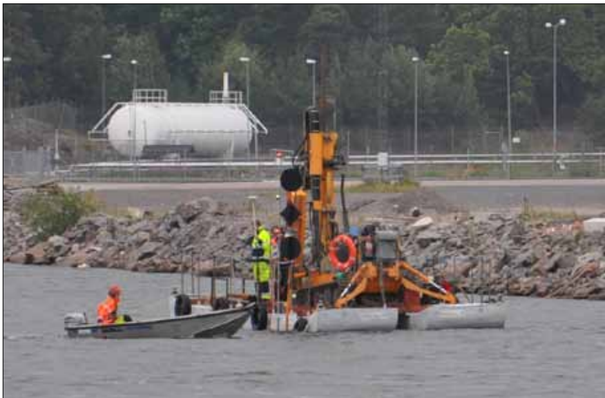
Geotekniska undersökningar pågår, på flotten finns en borrhandsvagn som utför provborrningar för att ta reda på djup och bergmängd.