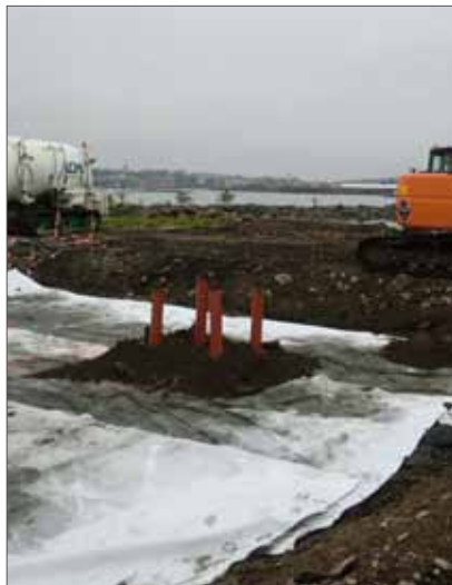
Grundvattenrör för provtagning av grundvattnet i det stabiliserade området. På den vita duken läggs bergmassor som överlast.