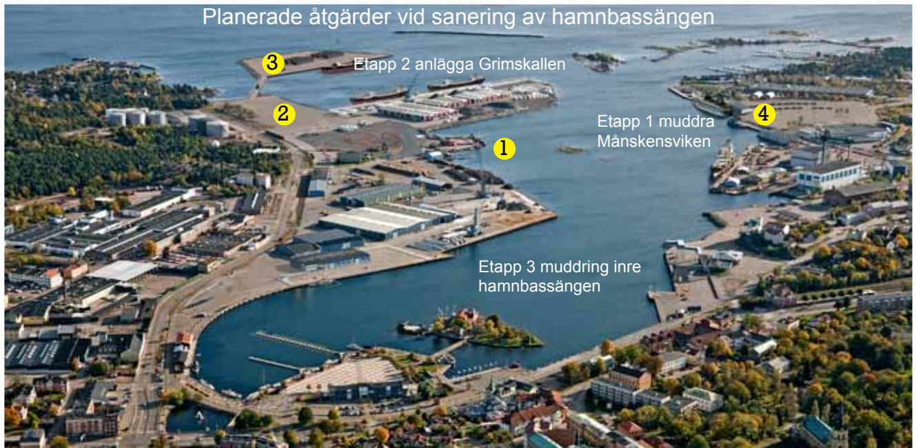
1) Rävänäset 2) Oljehamnen, 3) Grimskallen 4) Nya färjetterminalen Modellering: Prinofbergs

Nyhetsbrev 7 - Maj 2012 - Ansvarig utgivare: Kaj Nilsson