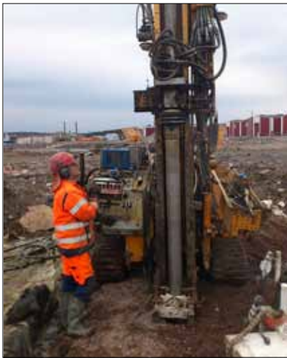
Provtagning i pilotförsöksområdet.