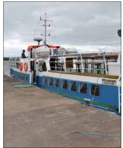
Välkomna på guidad båttur med Solkust