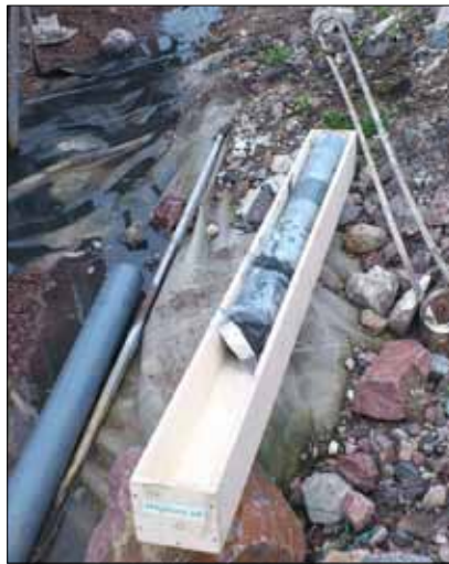
Sedimentpropparna skickas till jordartslaboratorium för tester.