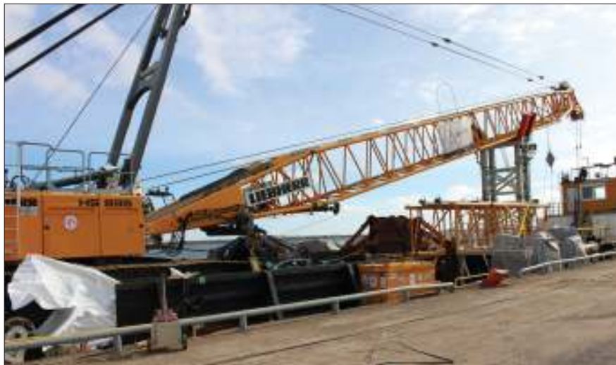
Förberedelser inför muddringsstart. Ett grävudderverk finns på plats i hamnen. Mudderverket är av typen linskopecverk med räckvidden 20 meter.