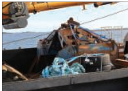
Nu pågår förberedelserna inför muddring. En tättslutande miljökopa monteras på den 20 meter långa grävvarmen.

Nu när projektet går in på sin tredje muddringssäsong kommer entreprenören Envisan att använda sig av ett grävudderverk. Grävudderverket har en tättslutande miljökopa för att minimera grumlingen.