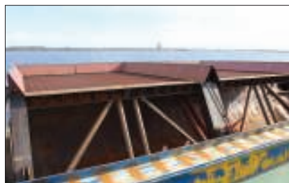
Rensningsgaller ombord på en av de två pråmarna.

Det nya mudderverket är av typen linskooperverk som styrs med hjälp av linor. Muddermassorna som grävs upp lastas på två stycken pråmar. Pråmarna körs sedan till hamnen för avlastning.