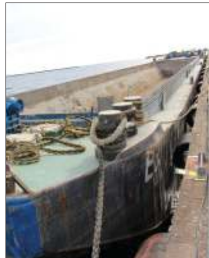
För att transportera muddermassorna till avvattningen används två pråmar som rymmer 880 m 3 sediment vardera.