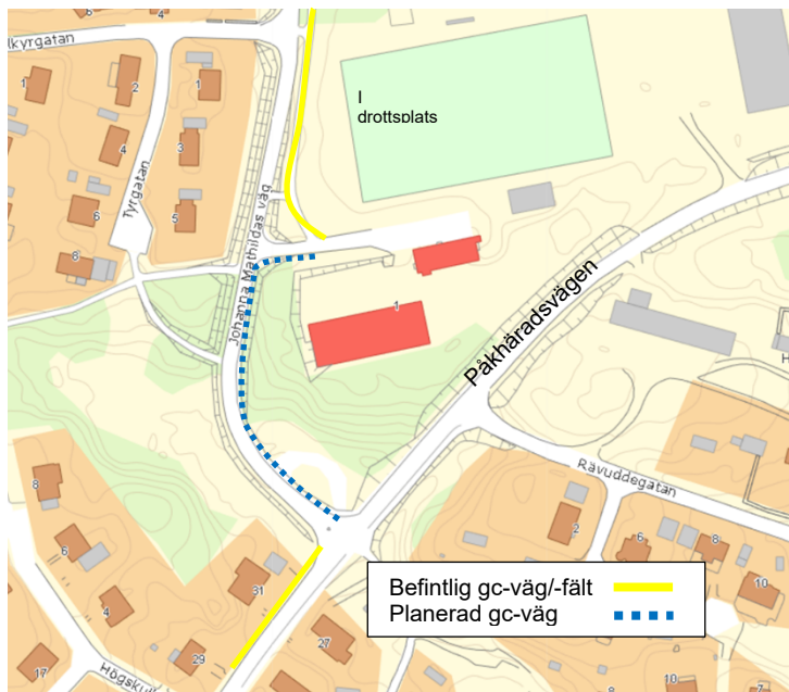
Figur 1. Ungefärlig sträcka för planerad gång- och cykelväg längs Johanna Mathildas väg i Figeholm

Från Idrottsplatsen norrut finns en gång- och cykelväg för boende på Elviragatan, Valkyrgatan, mfl gator, se figur 1. Längs Påkhäradsvägen i sydvästlig riktning från Idrottsplatsen finns ett cykelfält i bägge färdriktningarna. Däremot saknas gång- och cykelväg från korsningen Påkhäradsvägen-Idrottsplatsen. De bägge cykelstråken kan sammankopplas genom att bredda befintlig trottoar längs Johanna Mathildas väg för att på så sätt inrymma en GC-väg längs en sträcka på ca 150 m. I Oskarshamns kommuns cykelplan finns åtgärden med som nr. 3 för Figeholm. Den uppdaterade kalkylen för åtgärden uppgår till 675.000 kr. Statlig medfinansiering kan sökas om 337.500 kr. Finansiering av resterande del föreslås ske genom Tekniska kontorets budget för åtgärder på det kommunala gång- och cykelvägnätet.