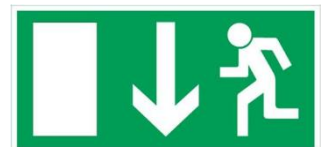
Exempel vägledande markering